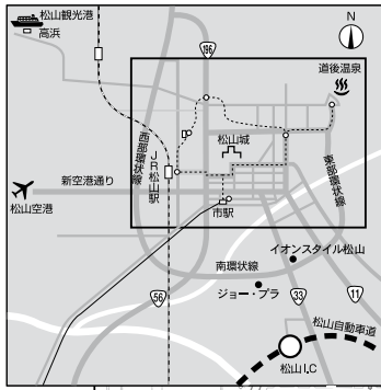
松山市街地図(会場および宿泊ホテル)